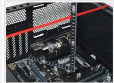
実測したものの、メーカー公表値は170mmと表示されている。ビルドワーカーの標準的な標準200mmのボディを考えると十分なスペースが確保できる。